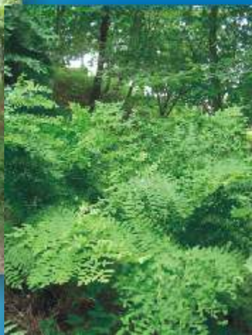
O estudo, reconhecimento e implantação deste PR foi feito em 2003 por Naturveredas, Lda para a Câmara Municipal de Arouca