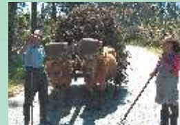
PEDRA POSTA 1222 m.